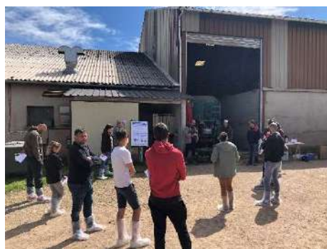
Intervention de E. MORIN sur les coûts de production au GAEC de Veyrac (12)

Ces deux journées ont bénéficié du soutien Région / FEADER, via la mesure 121 « information et diffusion de connaissances et de pratiques ».